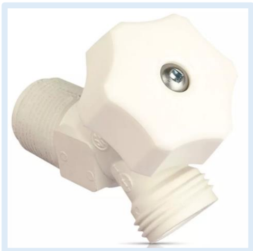
Válvula de drenado para calentador de plástico.