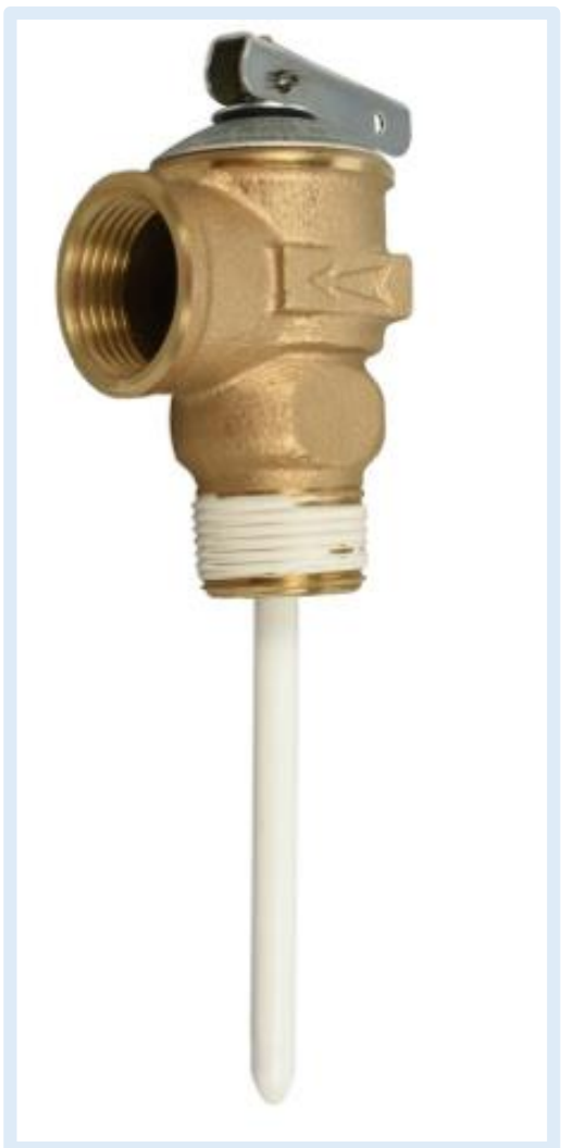
Válvula de alivia con apertura por temperatura y presión.